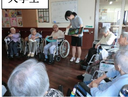
絵本を3冊、読んでくれました。