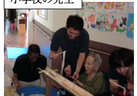
流しそうめんに参加していただきました。