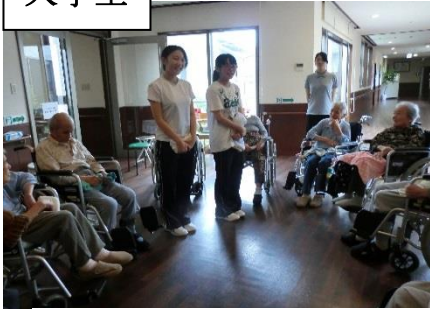
みなさんと体操をしました。